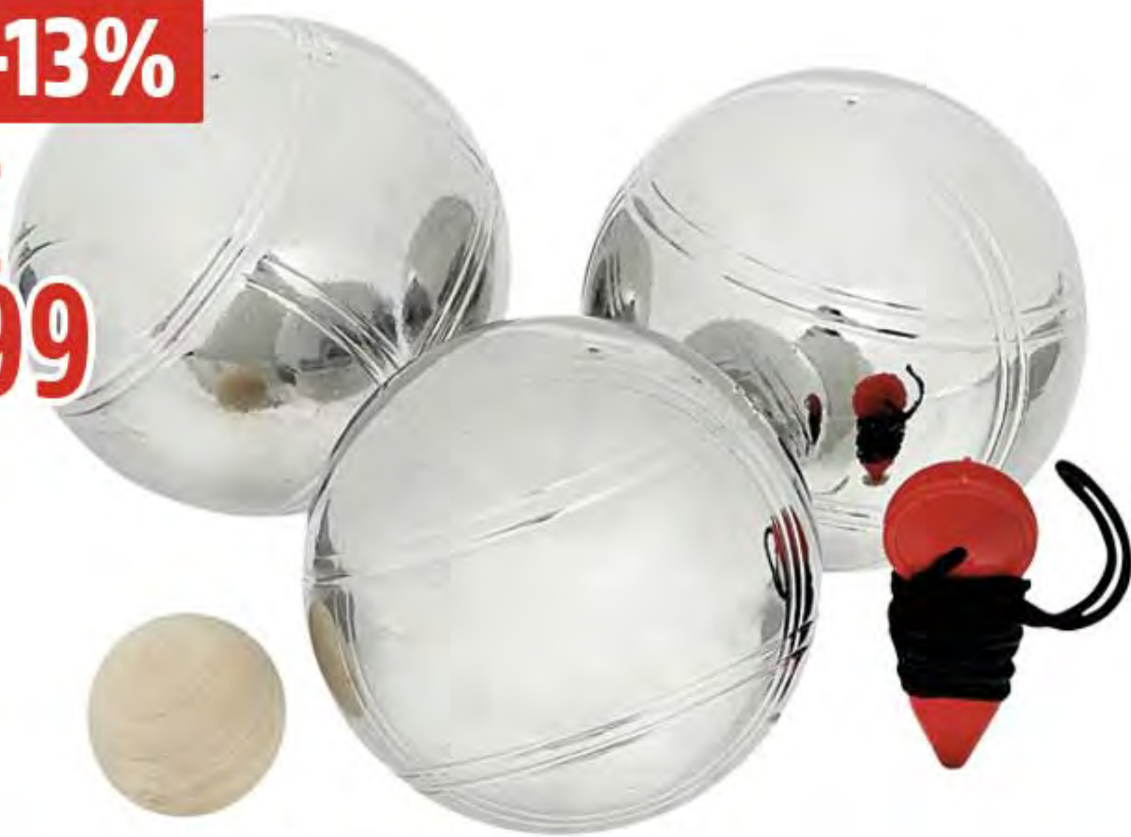
1. LOT DE 3 BOULES DE PETANQUES