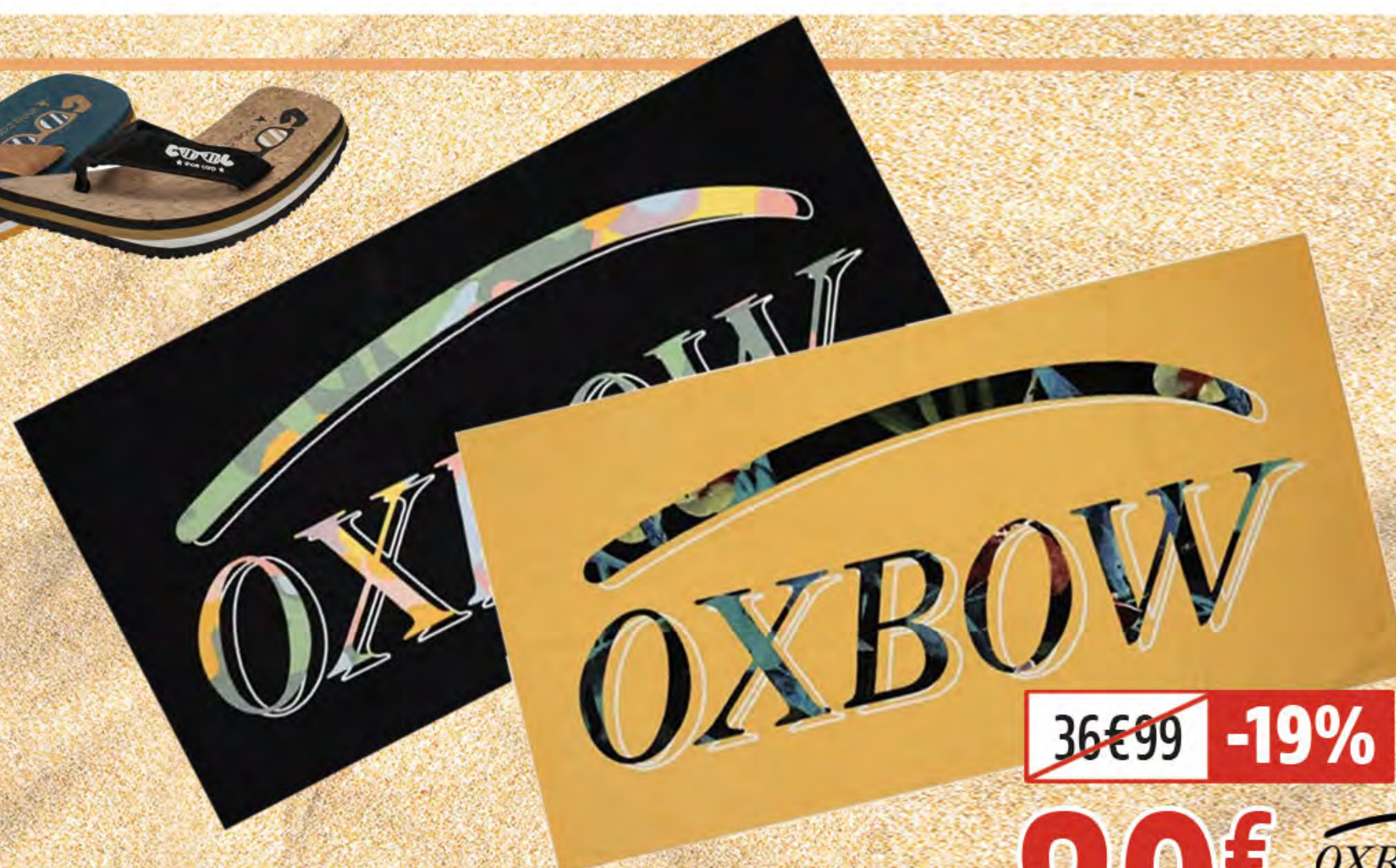
10. SERVIETTE DE PLAGE COTON VELOURS