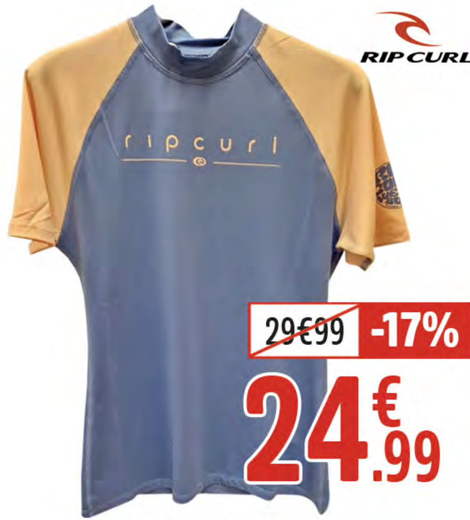
2. LYCRA MC GOLDEN FILLE