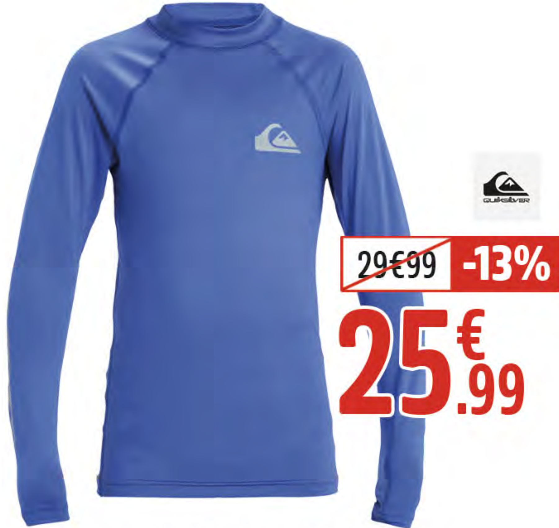
3. LYCRA EVERYDAY ML GARÇON UPF50