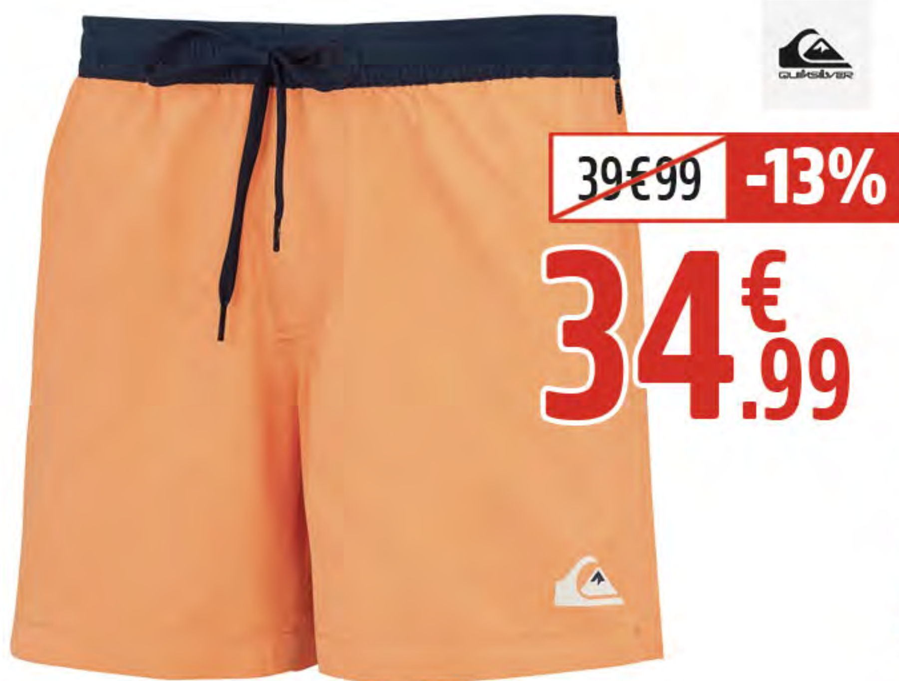
7. BEACHSHORT CRACK IN THE SKY HOMME