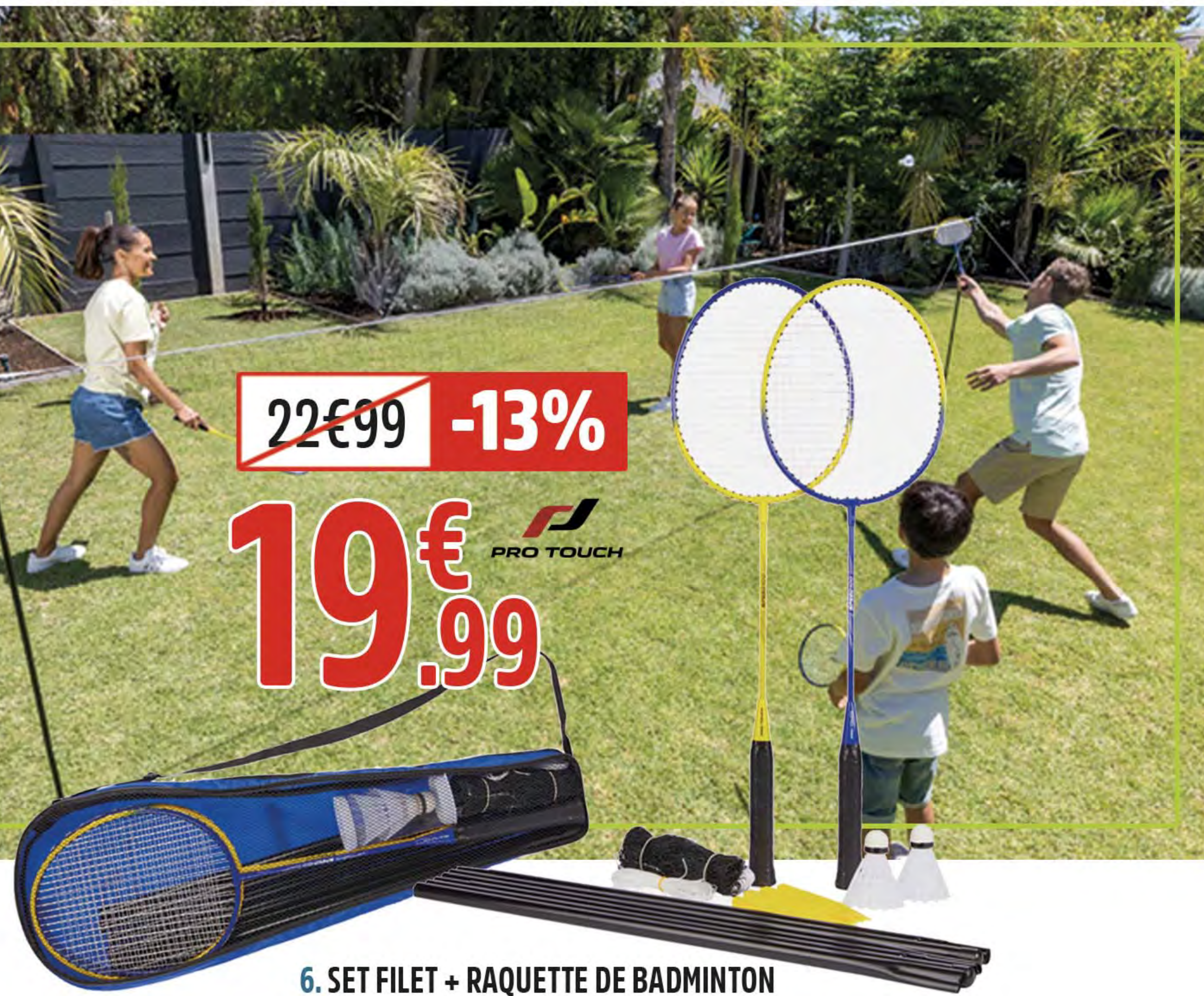
6. SET FILET + RAQUETTE DE BADMINTON

1. LOT DE 3 BOULES DE PETANQUES Set complet + housse - Réf. INT-HF3040 2. CERF VOLANT AVION PLANEUR Divers coloris - Réf. INT-2248658 3. FRITE DE PLAGE Divers coloris - Réf. INT-5300256 4. BALLE REBONDISSANTE 38MM Divers coloris - Réf. INT-1073536 5. BOOMERANG Divers coloris - Réf. INT-2248645 6. SET FILET + RAQUETTE DE BADMINTON Comprend 2 raquettes, 2 volants, 1 filet et 1 sac de rangement - Réf. INT-412064 7. BALLON DE PLAGE NEOPRENE La matière néoprène vous évite d'avoir un ballon gorgé d'eau - Réf. INT-2248677 8. BALLON FOOT MOUSSE 195MM - Réf. INT-2248815