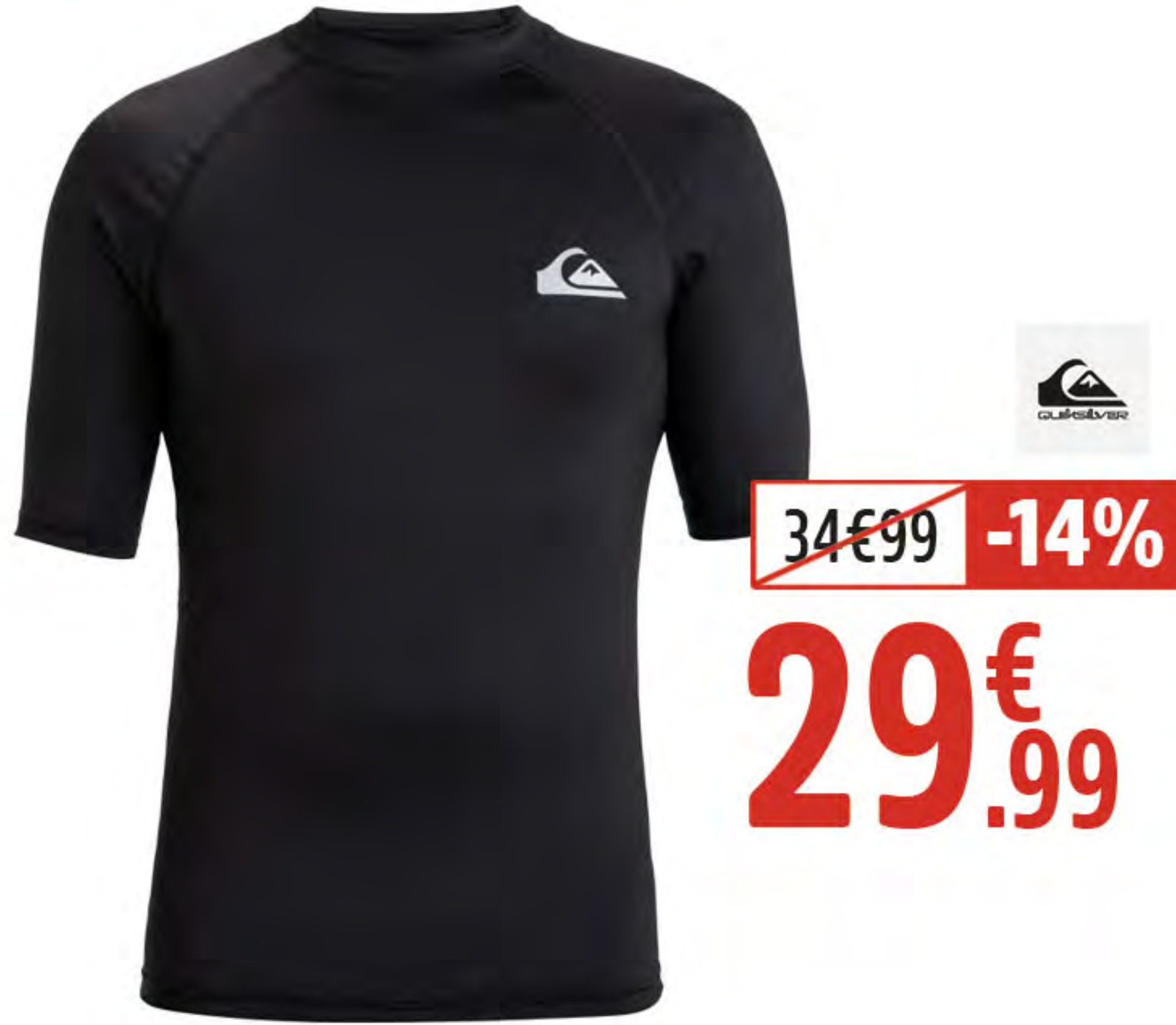
4. LYCRA UPF50+ MC BASIC HOMME