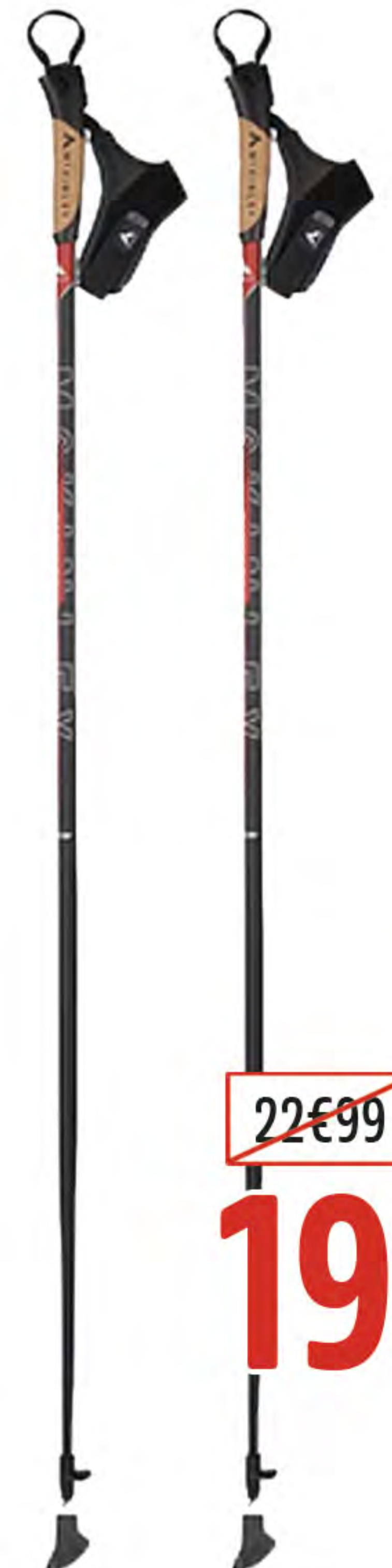
8. BATON DE RANDONNÉE MIGRA 01