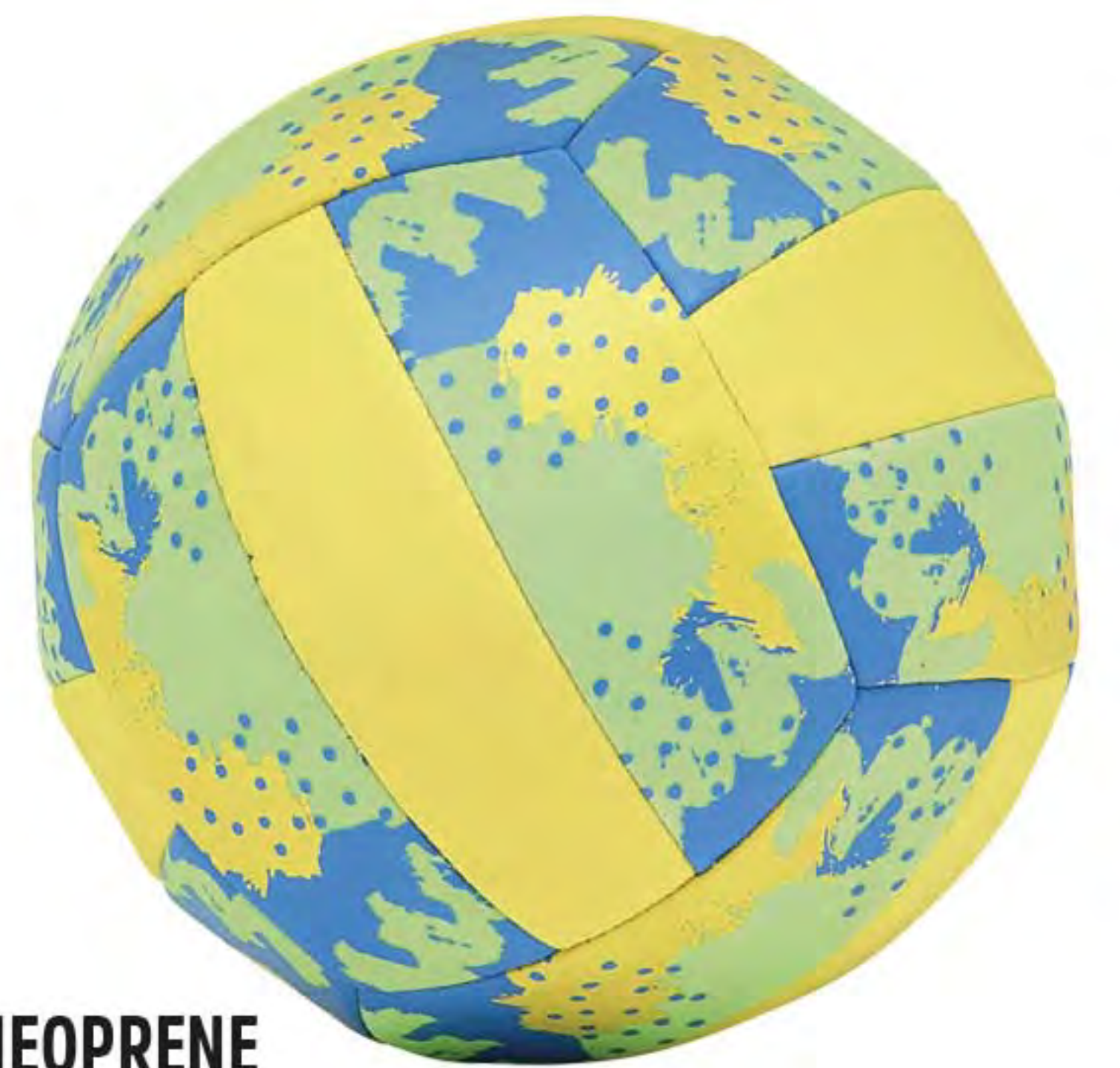
7. BALLON DE PLAGE NEOPRENE