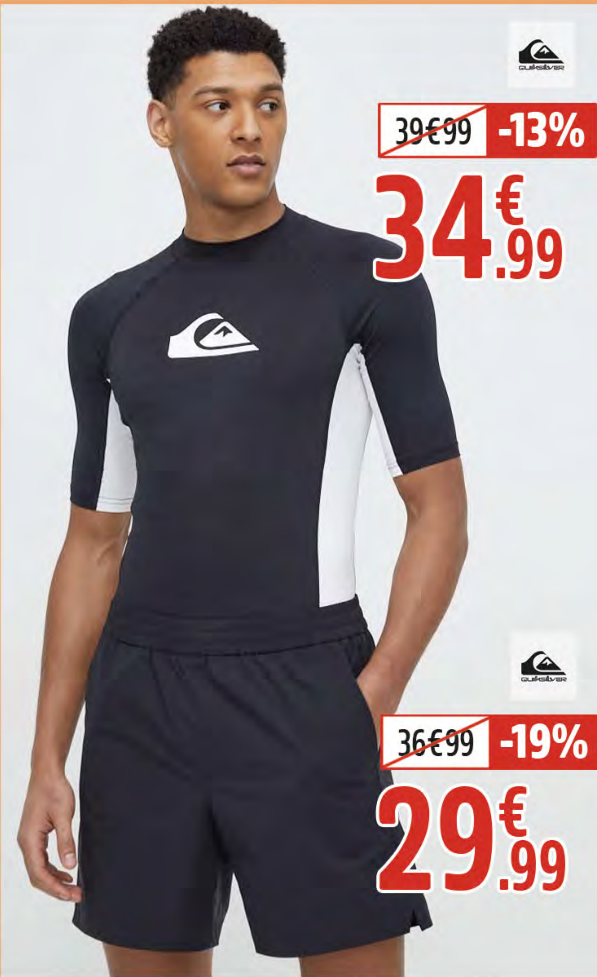
5. LYCRA MC UPF50+ HOMME 6. BEACHSHORT EVERYDAY SOLID 15 HOMME