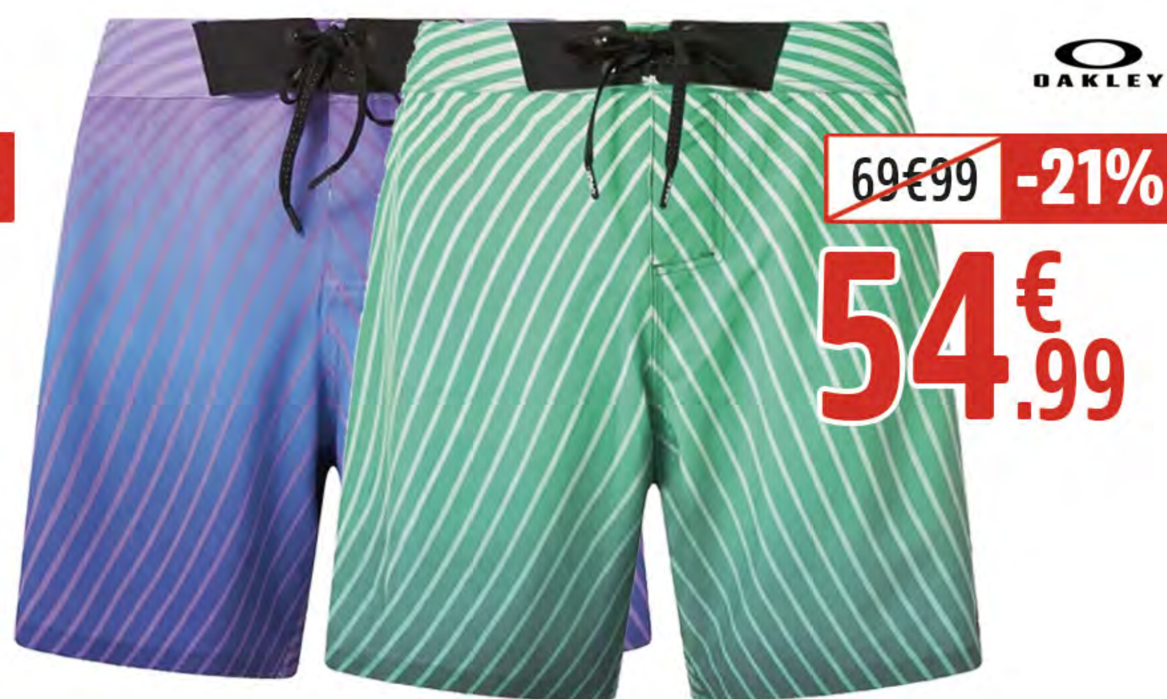
8. BOARDSHORT TEMPESTAS HOMME