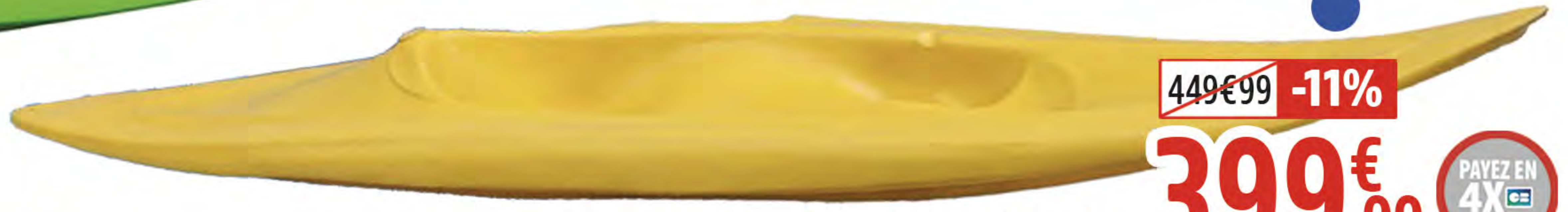
1. KAYAK MOJITO 1 PLACE