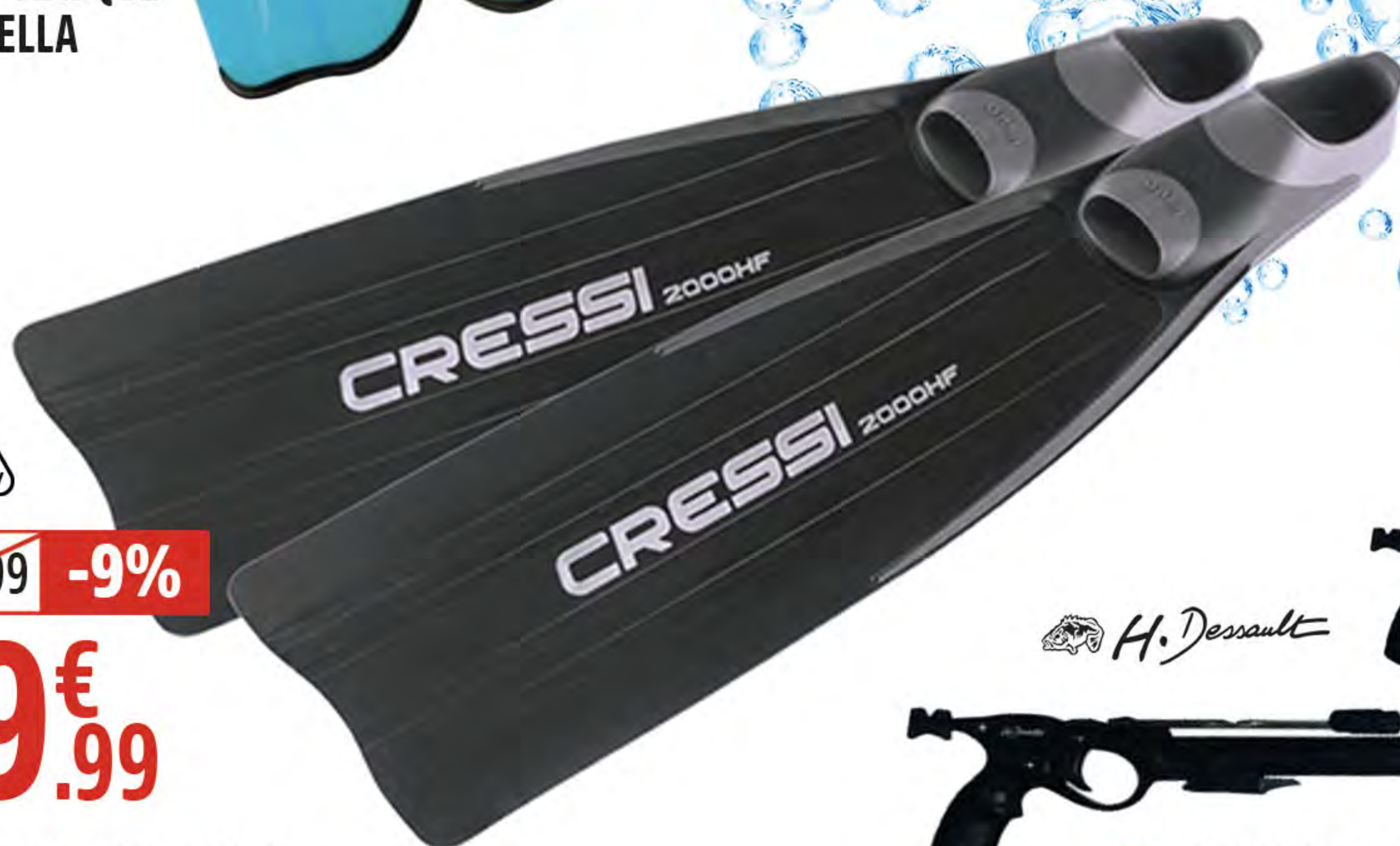
6. KIT PALMES + MASQUE + TUBA RONDINELLA