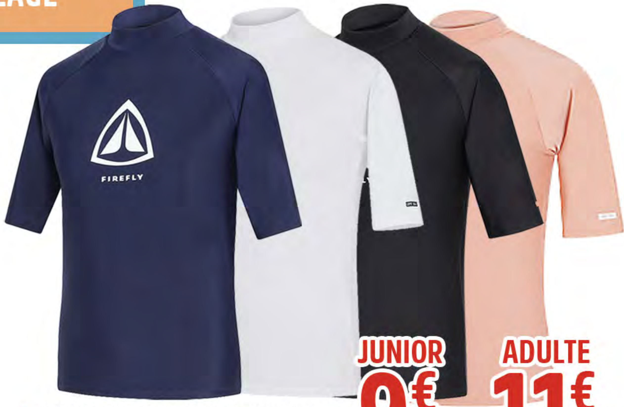
1. LYCRA MALIBU MANCHE COURTE ADULTE & JUNIOR