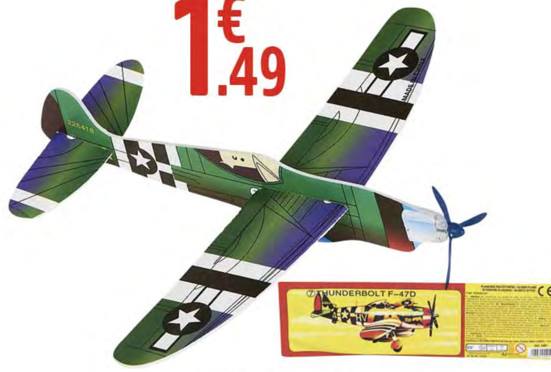
2. CERF VOLANT AVION PLANEUR