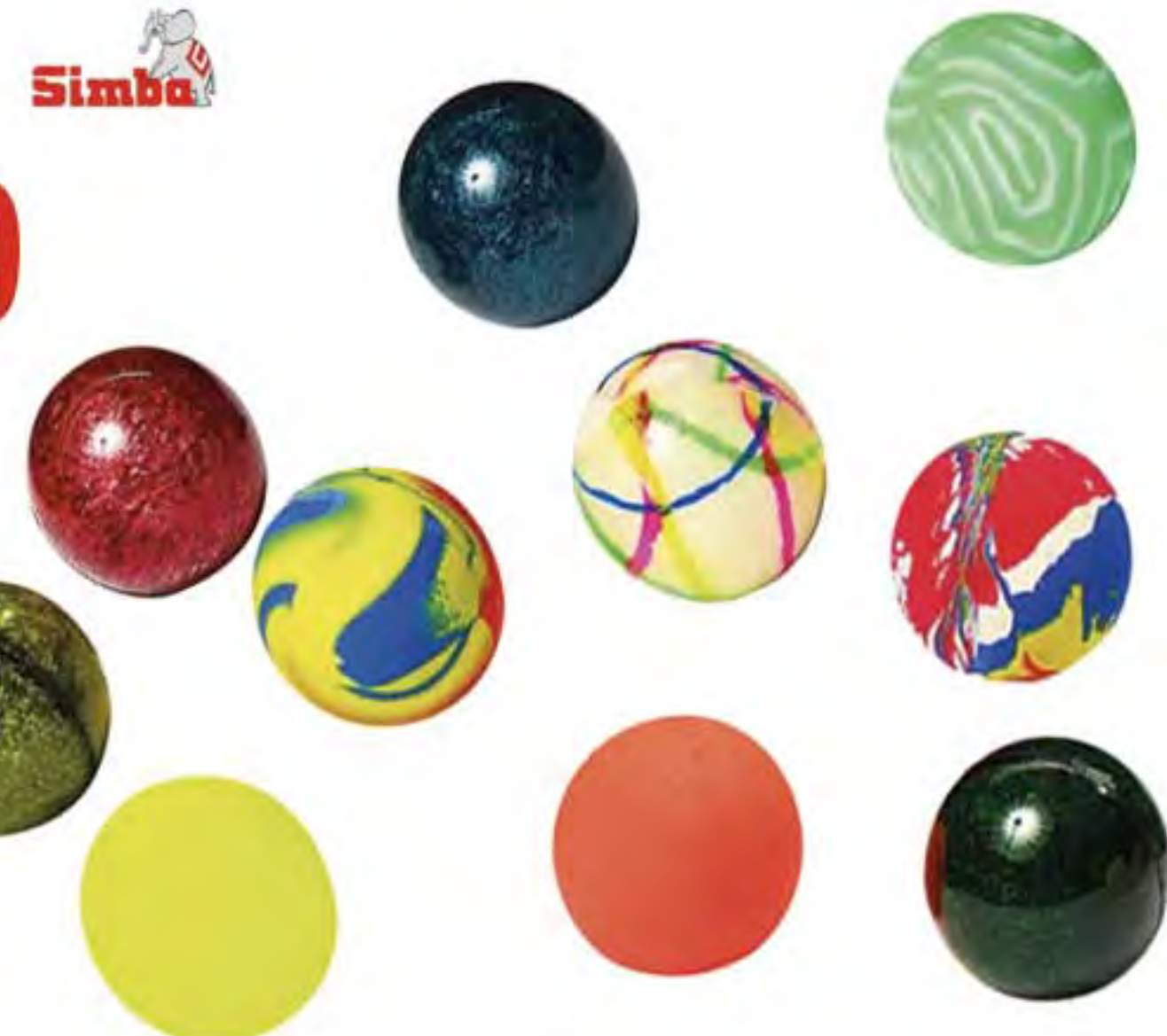
4. BALLE REBONDISSANTE 38MM