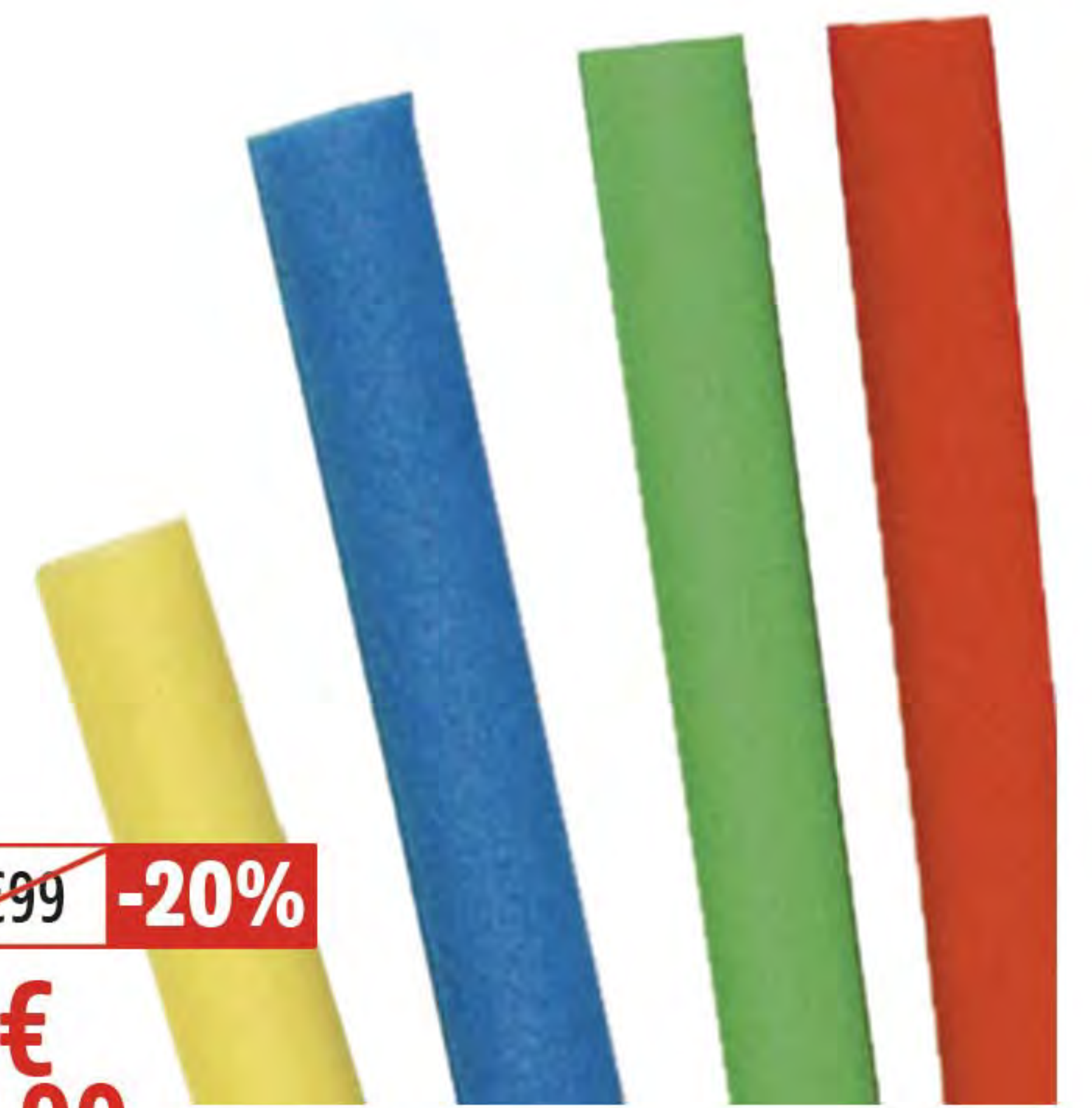
3. FRITE DE PLAGE